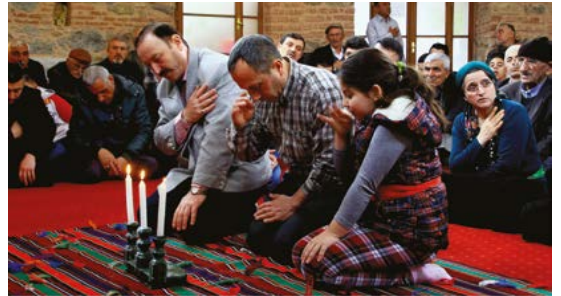
Delici -Hak, Muhammed, Ali

21 Mart Hz.Ali’nin doğumu olarak kabul edilir.